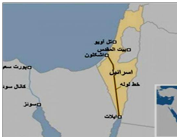
نقشه ۱- انتقال نفت و گاز امارات به مناطق اشغالی از طریق خط لوله ایلات اشکلون